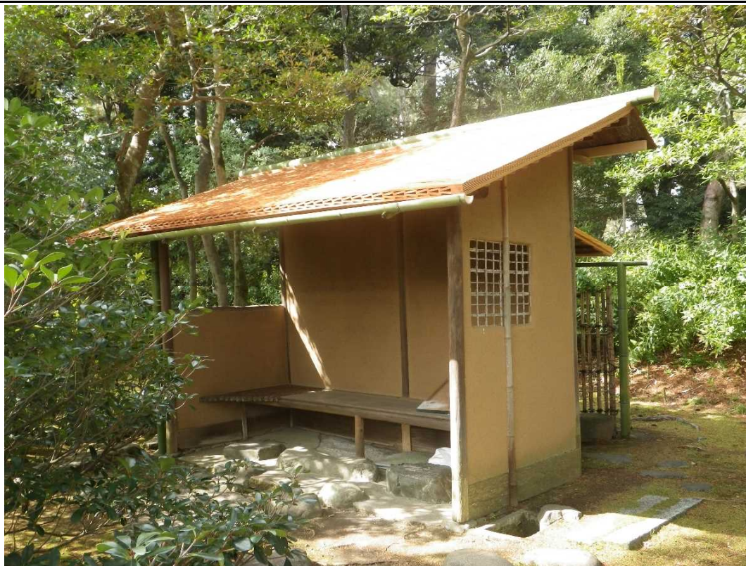
こけら 柿葺屋根の葺替が完了しました。